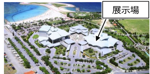
沖縄コンベンションセンター