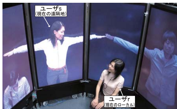
図 5: 組み体操コンテンツへの同期的な参加

機能を多数揃えるだけでは、ユーザがそれらの機能を理解したり柔軟に組み合わせて新たなアプリケーションを実現することが困難である。簡潔な機能を体系的に提供し、それらを容易に組み合わせる方式を見出す必要がある [8]。