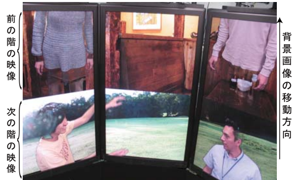
図 3: 下降するエレベータから見える風景を感じさせる背景の動き

遠隔地との同期的、非同期的コミュニケーションを区別なく操作できることを示すために、複数の過去の重ね合わせとコンテンツ部品化の機能を用いて組み体操コンテンツを作成した。楽曲制作における多重録音のように複数の過去を重ね合わせることで、t-Room 上でビデオコンテンツを作成することができる。図 4 は t-Room を用いて作成された組み体操コンテンツである。まず面 1 のユーザ p が体操をし、次に面 2 のユーザ q がその様子を再生しつつその体操に参加する。以下面 3 のユーザ p、面