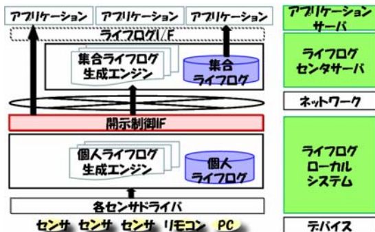
図1 ライフログプロトタイプシステムのアーキテクチャ (文献[1]より引用)

筆者らは「ライフログの保存場所」と「ライフログ提供の設定方法」の観点からアーキテクチャやユーザインタフェース等を検討している。データの保存場所についてはプライバシー等の問題から自らのライフログは基本的にユーザの所有する端末上（ローカル環境）に蓄積することが望ましいと考え、ローカル環境へのライフログ蓄積を考慮し図1に示すアーキテクチャを提案している[1]。取得したデータ（GPS 端末からの緯度・経度情報等）は一旦ローカル環境へ蓄積し、ローカル環境内で特徴抽出（滞在地情報、移動手段情報等）を行いユーザがサービス提供者へのライフログの開示の判断を行いやすくした上で、ユーザの開示判断後にユーザが提供許可したもののみをセンタサーバへアップロードしてオンライン上で保管し、必要に応じてサービス提供者へ提供する。