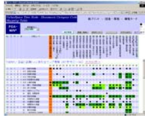
Fig.4 PDA マップ + 履歴情報の重畳表示画面

ValueSpace の操作履歴 ( 検索および参照 ) を DB に蓄積しておく。GUI としては PDA マップにこの操作履歴を重畳表示することで、定義情報と実績情報の差異を容易に把握可能となる ( Fig.4 )。