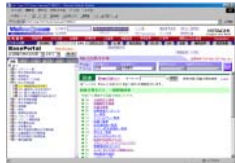
Fig.1 ValueSpace の画面

3 で述べた PDA マップをベースとして、発電プラント開発における業務プロセス誘導を実現するエンジニアリングナビゲータ "ValueSpace" を開発した (Fig.1)。