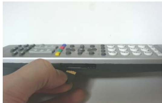
図1. 操作ログを記録するリモコン

実生活で使用している TV に対応し、日頃の操作感ができるだけ変わらないように考慮し、多くの TV メーカーのリモコンコードが予め登録されている市販のプリセット型リモコンを利用することとした。また、ログを記録するために、日付を得るための時計とメモリ (microSD カード) を装備した (図1)。1回の操作につき、日時と、コード化された操作内容をログとして記録する。これらの改造は、ユーザのリモコン操作に影響を与えることはない。