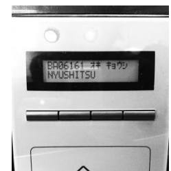
図 3 IRWのLCDとLED

また、これらの状態の変化をユーザに直感的に伝えるために、状態によって音の鳴り方や、LEDの光り方を変えている。