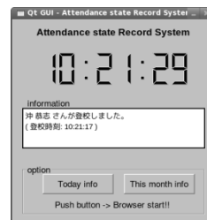
図 2 GUI画面

PaSoRi を使用したクライアントでも、IRW でも同様の動作をする。PaSoRi を使用したクライアントでは GUI 画面によって時間と、学生証をかざした時の状態の変化を確認することができる (図 2)。IRW では LCD へ学生証から読み取った学生番号と名前、そして状態の変化を表示する (図 3)。