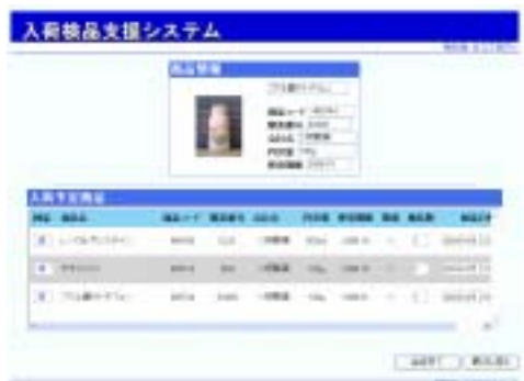
図 2 RFID 応用検品支援システムの画面イメージ

卸業者で、トレース情報を収集する手法として、RFID を応用した入荷検品支援のプロトタイプシステムを開発した。バーコードを利用する従来の検品システムとは違い、無線で ID を飛ばすため、箱に詰められた状態のままでも、検品作業ができる。そのため、作業負荷が軽減できる。