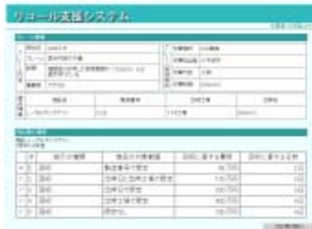
図 4 リコール対応支援システムの画面イメージ

ここでは、メーカーで製造した「L-カルボシステイン」という薬品の使用期限に、誤った表示がなされているとのクレームを薬局から受け付けとったと想定している。この場合、メーカーは誤った表示のある商品を回収しなければならない。図 4は、回収の意思決定者に提示する画面で、回収に要する費用と日数の見積を表示している。