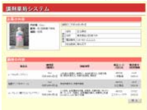
図 3 処方薬情報提供システムの画面イメージ

ここでは、処方薬の原料となった薬品の一覧と、それぞれの詳細な情報（調剤量 / 調剤日、効果効能、薬品コード /