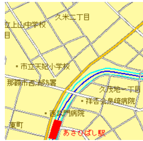
図 4: 那覇市街地図