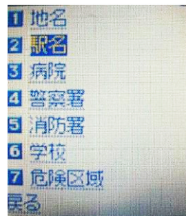
図 6: TOP 画面