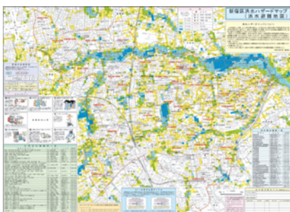
図 1: ハザードマップ [1]

日本列島は台風や地震のような自然災害の発生しやすい地域であり、たびたび災害による莫大な被害を受けている。そこで国土地理院や地方自治体では、全国の地形、道路、避難場所、学校や病院などの公共施設、消防署や警察署などの公共機関の地理調査を行い、災害や2次災害による被害を防止するためにハザードマップを作成している(図1)。また、ハザードマップは被害