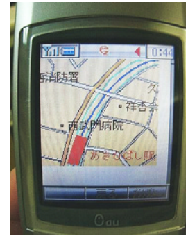
図 5: データ受信画面

くさが原因と考えられる。しかし、日本列島は災害の種類も多い土地であるため災害も複雑になってくる。そこで、手軽に誰にでも解りやすく支援を行う事ができるダイナミックハザードマップで有効的に使われるのではないかと考えられる。