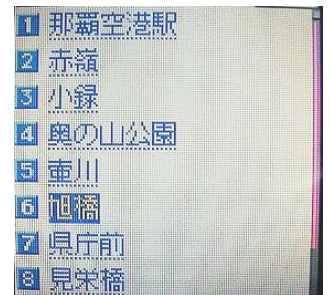
図 7: 駅選択画面