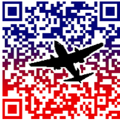
図 3 デザイン QR(文献 [4] より引用)