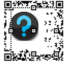
図 10 非組織符号化によるロゴ b の最大埋め込みサイズ