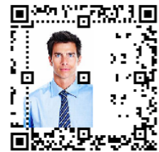
図 16 非組織符号化による人物 b の最大埋め込みサイズ