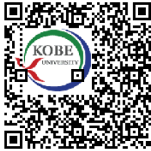
図 7 誤り訂正能力によるロゴ a の最大埋め込みサイズ