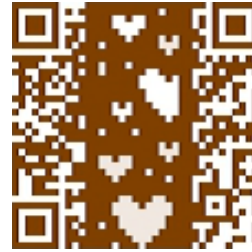
図 5 QR-JAM(文献 [6] より引用)