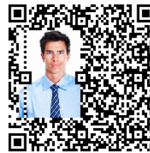
図 15 誤り訂正能力による人物 b の最大埋め込みサイズ