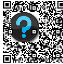
図 9 誤り訂正能力によるロゴ b の最大埋め込みサイズ