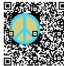
図 11 誤り訂正能力によるロゴ c の最大埋め込みサイズ