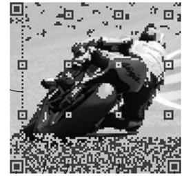
図 6 文献 [7] の手法

章では両方式の概要を説明すると共に、それぞれの方式を用いた既存研究について示す。