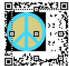
図 12 非組織符号化によるロゴ c の最大埋め込みサイズ