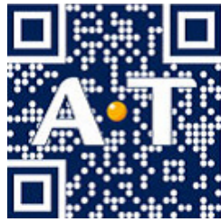
図 4 ロゴ Q(文献 [5] より引用)