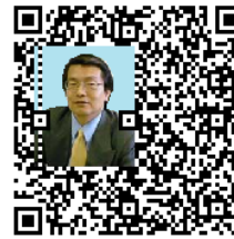
図 13 誤り訂正能力による人物 a の最大埋め込みサイズ

誤り訂正能力を用いてロゴ a の画像を最大サイズで埋め込んだ QR コードを図 7 に示す。また、非組織符号化による画像埋め込みを用いてロゴ a の画像を最大サイズで埋め込んだ QR コードを図 8 に示す。その他の画像についても同様に、誤り訂正能力による方式と非組織符号化による画像埋め込み方式で最大サイズまでロゴ b の画像を埋め込んだ QR コードを図 9 と図 10 に、ロゴ c の画像を埋め込んだ QR コードを図 11 と図 12 に、人物 a の画像を埋め込んだ QR コードを図 13 と図 14 に、人物 b の画像を埋め込んだ QR コードを図 15 と図 16 にそれぞれ示す。