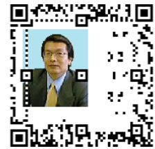
図 14 非組織符号化による人物 a の最大埋め込みサイズ