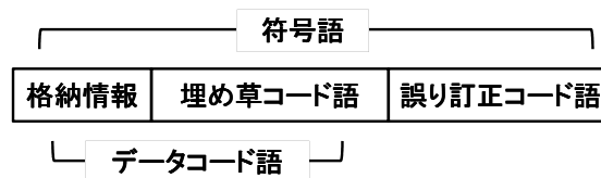
図1 QRコードにおける符号語の構成

QR コードの仕様では RS 符号は組織符号化が行われる。これは、符号語の前半に情報点を配置し、後半に検