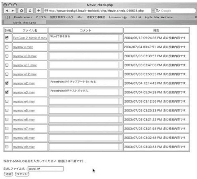
Fig. 2 SMIL generator

取り込まれた映像は、Fast Start によるダウンロード時間を無視すれば、Web サーバーに保存した時点で閲覧する事が可能である。また、SMIL は HTML に似たタグ形式のテキストファイルであり、文法も難しくない。しかし、大量のコンテンツを短時間でオーサリングするために、授業終了後、Fast Start に対応した変換（上述）を行った映像素材を Web ブラウザーからオーサリングする SMIL ジェネレーターを開発した。SMIL ジェネレーターを Fig 2 に示す。SMIL ジェネレーターは Apache と PHP を用いてい