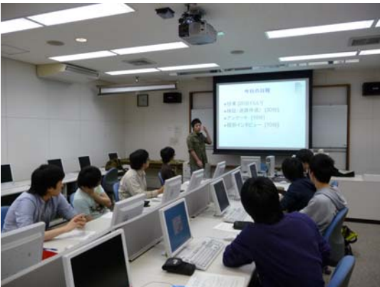
図 1: 検証の様子

導入期の苦手意識の変化の検証としてプログラミング学習経験の無い大学生 20 名を調査対象として検証前アンケートを実施して、その後、プログラミングの模擬授業を一斉画一型の授業形式で行った。図 1 の写真は授業時の様子である。