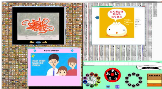
図1. ブラウズリーダで探し当てた3冊の絵本を一般リーダで読んでいる様子

冊子体絵本と調和を保つために、ウェブ絵本の見せ方および扱い方は冊子体絵本を参考にして統一化する。冊子体絵本に近い見せ方は子どもに好まれる見せ方であり[7]、調和が保てるだけでなく子どもにとってよい読書環境を提供できる。