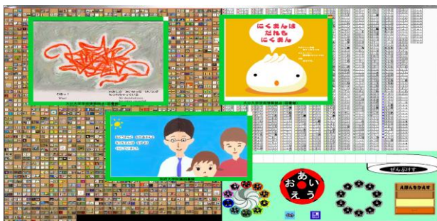
図3. ブラウズリーダ上の統一化リーダでの読書