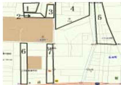
図 1 呉市広古新開周辺地図

本調査対象は, 広島県呉市広古新開周辺地域のアパートやマンション, 集合住宅等とした. 図 1 に測定ポイントの地図を示し, 表 1 に測定エリアの特徴を示した.