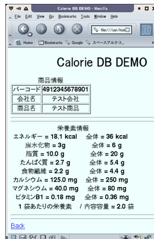
図 6: カロリー DB 情報取得画面

XML としては、カロリー DB のサブセットとしてカロリーのみを取得する XML を XIRD に送信している。XIRD を利用することで将来データ構造が変化した場合