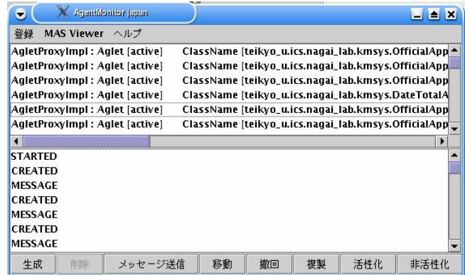
図 3 エージェントモニタ

FM から提供される OS リソース情報はマルチキャスト方式のメッセージで SA に通知される。SA の開発においては、FM から送られてくる OS リソース情報を利用するこ