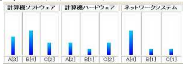
図3. 棒グラフによる不得意分野表示の実行結果