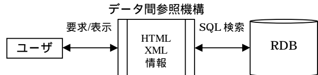
図1. データ参照の構造

ていない状況で、履修申告してしまうミスも起こってしまう。履修申告Webシステムに、シラバスを組み込みデータ参照を行うことでユーザの履修申告を支援する。