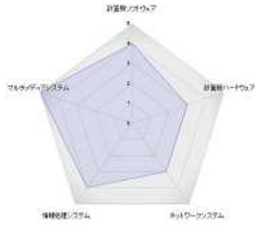
図4.レーダーチャート

棒グラフとは違い各分野の評価が一つの円グラフにまとまるため、単にポイントの合計ではなく、分野別に取得した科目