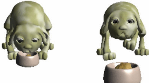
図2. ペットのアクションの違い

の違いによるアニメーションの違いを図2に示す。左が順位が高く素直にごはんを食べているアクション、右が順位が低くごはんをつき返しているアクションである。