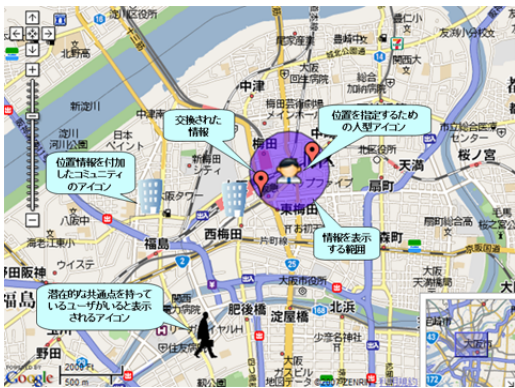
図 2: 地図インタフェースのイメージ図

SNS内で作成されるコミュニティには位置情報を登録しておく。位置情報が登録されたコミュニティは、地図上にアイコンが表示され、そのアイコンをクリックすると登録された場所の周辺を通った人の所有する情報を閲覧することができる。また、コミュニティの中では、そのコミュニティに参加しているユーザの持つ情報も閲覧することができる。