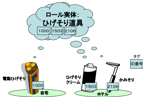
図2 ロール実体による可搬化

電動ひげそりが含まれ、ホテルではかみそりとひげそりクリームが含まれる。ホテルでは電動ひげそりが存在しないため、自宅で生成した行動パターンを用いて外出の行動を検知することはできない。