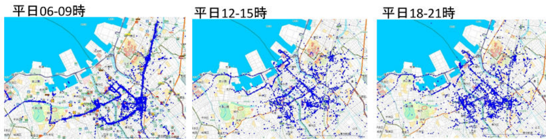
図2 パーソンプローブ プロット

パーソンプローブ分析 2012/10/9~2012/12/9 モニター160名 108,270件