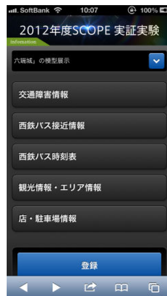
図 1 リファレンス・アプリ

ニュース 、 交通障害情報 、 バス接近情報 、 バス時刻表 、 観光情報 ・ エリア情報 、 店 ・ 駐車場情報