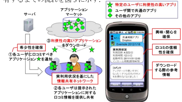
図3 アプリケーション情報共有の流れ

NoE はユーザ x が利用したアプリケーションの総数、 NU はユーザ x が属する情報共有ネットワークのユーザ数、 Dreq(i) は情報共有ネットワーク内でアプリケーション i を利用するユーザ数を示す。式(3)をすべてのユーザに対して行い、サーバ側から共有情報として価値の高いアプリケーションを各ユーザに通知する。ユーザがこれらに対するロコミ情報を提供することで、希少性のある価値の高い情報の共有が可能になると考える。アプリケーション情報を共有するまでの流れを図3に示す。