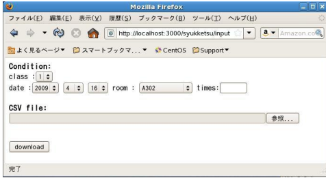
図 2: 教員向け Web アプリケーション 1