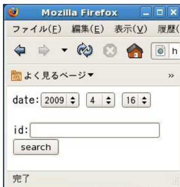
図 4: 利用履歴検索 Web アプリケーション

終了前何分に出席チェックを行うか」の2つのパラメータを設定し、処理実行のためのボタンをクリックする。入力された2つのパラメータをもとに出席判定された結果が書かれた CSV ファイルを入手できる。出席判定結果が書かれた CSV ファイルには、出席には「1」、欠席には「0」、判定不能の場合には「2」（データベース上にログが存在しないなど）が記される。今回の開発では講義開始日からプルダウンメニューで選んだ日付までの判定結果を返す。このようにして、教員は受講者の出席状況を CSV ファイルとして取得できる。また、これらのページに加えて、ある特定の学生の利用履歴およびその状況を表示する図 4 のような Web アプリケーション