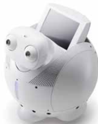
Fig.2 Overview of "ApriAlpha"

・ 移動動作 ：生後6ヵ月頃には這い這いを、12ヵ月頃には歩き始める。乳幼児にとっての移動は、身体動作の発達の表れであり、活動範囲も急速に広がり、動くものや見馴れないものを見るとそちらへ行こうとする探索動作が表れる。ロボットにおいてもまずこの探索動作を取り入れる。しかし、ロボットの車輪による移動は、乳幼児とも、模倣対象となるユーザとも、身体性が大きく異なる。そのため、動作についても動作変換を含めた検討が必要であろう。