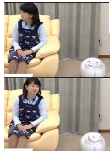
Fig.3 Looking to same direction