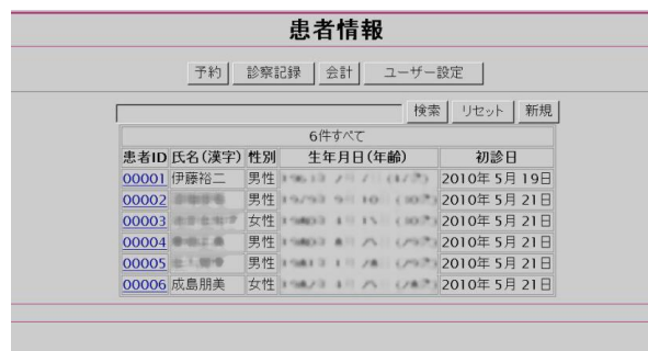
図 2 ページのデザイン例 (電子カルテを想定した場合)

全盲者が内容を理解し易いように一度に提示する情報量を抑え、かつ、関連する項目をまとめて配置する。例えば、データ情報管理においては、初期画面では検索、レコードへのリンク、新規作成ボタンを提示する。そして、レコードのリンクが選択された場合は、レコード詳細、更新ボタンなどを提示する。更に、ページの構成を固定部分 (ページに依存せず常に同じ情報が提示される部分) と可変部分 (ページ依存で変化する部分) に分け、固定部分に操作案内へのリンク、他ページへのリンク等を配置することで一貫性のある操作が可能になる。電子カルテを想定して作成したページのデザイン例を図 2 に示す。"予約"から"ユーザー設定"までが他ページへのリンクを示す固定部分、それ以下が可変部分である。