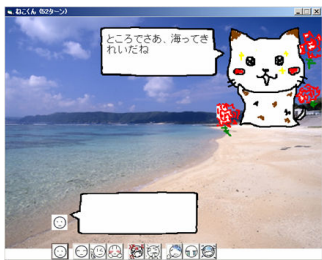
図 4 背景画像を伴ったシステムのインターフェース画面

話題切り替えの際に、上記の手法で関連付けした話題と背景画像を提示する会話システムを構築した。システムのインターフェース画面を図 3 に示す。