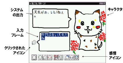
図1 システムのインターフェース画面

これらの機能によって、膨大なデータを用いることなく、比較的永く持続する会話が実現している。