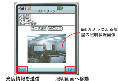
図 4: 携帯電話画面

図 4 に示すように、Web カメラボタンを押すことによって、Web-Server に接続されている Web カメラから部屋の状況画像を取得できる。