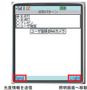
図 3: 携帯電話画面