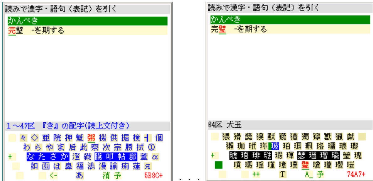
図2 おい入力により漢字語句を入力して行く過程の鍵盤