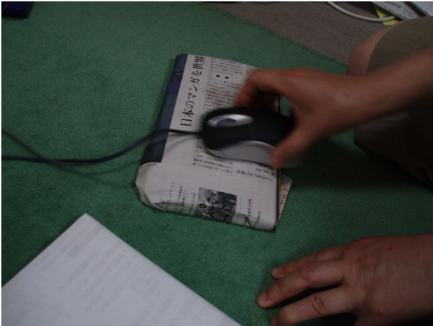
図 3: 実験の様子

最初に、マウスポインタとマウスの動きが連動していることを伝え、赤色の円にポインタをあわせてほしいことを示し実験を開始した。実験の様子を図3に示す。