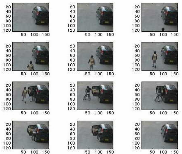
Fig.1 自動車を用いた拉致誘拐

定され、現在起こりつつある事態や状況を判断し適宜対応することは有人監視が可能な場合に限られる。従って、何らかの方法により映像情報から防犯状況を自動的に判断することができれば、夜間の山道や路地裏など、時間・場所にかかわらず稼働する恒常的防犯システムの実現が期待される。