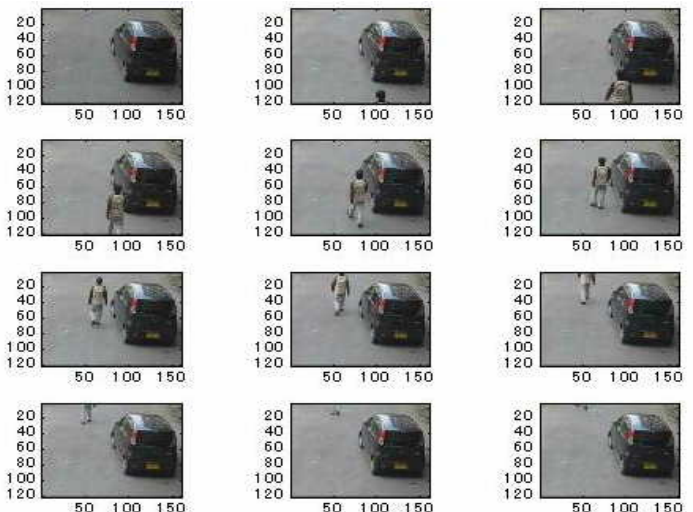
Fig.2 自動車周辺を通過する歩行者