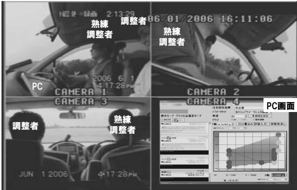
図 2: 実験の様子