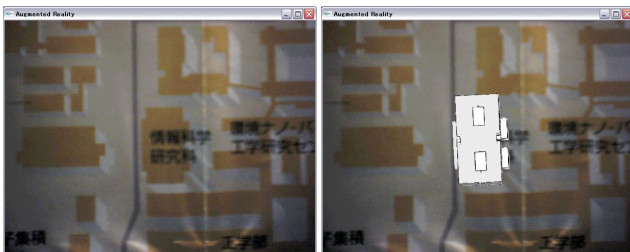
図3 正面から見た場合におけるシステムの動作例

しかし、正面から見た場合とは違い、右斜めからなどカメラを傾けた状態においてシステムを通して案内図を見ると、仮想 3 次元形状の建物は正確な位置・角度で表示されないことが多かった。また仮想 3 次元形状の建物の細かなぶれが発生することが確認された。