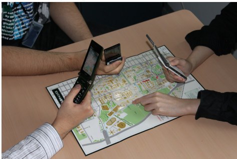
図1 想定するシステム利用例

本システムを応用すれば、ユーザは案内図と携帯電話などカメラが付いた携帯機器を持って歩き回り、随時実際の建物と案内図上の建物とを比べることができるようになる。また案内図があれば、旅行の計画を立てる際などに、複数人で話し合うことも可能となる (図1)。各々が携帯機器を持つことで、自由に案内図と表示されている建物を見ることが出来る。一つの建物を複数人が別方向から観察しながら対話することが可能となる。本研究ではノートパソコンとWebカメラを用い、案内図として北海道大学札幌キャンパスの構内図を用いる。