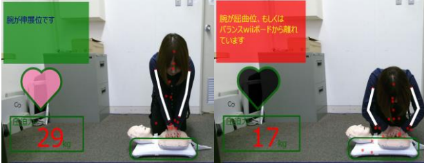
図 3 AR による伸展位圧迫(左)と屈曲位圧迫(右)

システムでは、Kinect センサーカメラからのユーザ姿勢映像に情報を重畳表示するようにした。図 3 のように、システム開始時にユーザの骨格情報を取得する際に、取得成功の確認機能として「両肩・両腕が白色ライン」で強調表示される。ユーザは腕や肩・頭の姿勢推定の AR 表示を意識しながら、腕が伸展位になる姿勢維持を目標に、正しい胸骨圧迫姿勢を学習することが可能である。