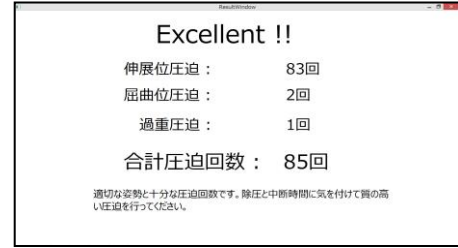
図 5 達成学習フィードバック画面例