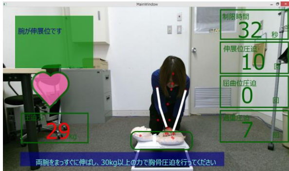
図 4 床面設置の報知モニター表示例

図 4 のように 1 分間の胸骨圧迫後、伸展位圧迫と屈曲位圧迫、過剰圧迫それぞれの回数の各達成値に評価コメントを付加する達成学習評価モジュールを実装した。図 5 は 80 回以上の伸展位圧迫が達成したときの学習フィードバック表示でシステムに保存される。