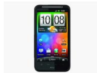
図2: スマートフォン: HTC Desire HD (OS: android 2.3.3) [2]

塩、砂糖、酢、タバスコは水溶液を作成して試料とした。塩と砂糖は4%、酢とタバスコは50%の濃度とした。各試料の量は50mlで同一とした。試料温度は20-23℃とした。