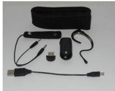
図1: 簡易脳波計 B3 Band [1]

本実験では、砂糖、塩、酢、タバスコ、並びに、ドクターペッパー、オレンジジュースの6種類を試料として選定した。それぞれ甘味、塩味、酸味、辛味の四種の味覚を代表する試料溶液と、炭酸飲料及び果汁飲料である。ここで、