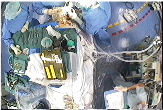
図 1 実験画像