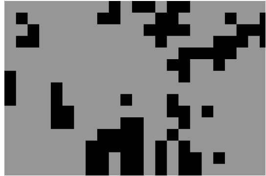
図 2 提案手法による分割の様子