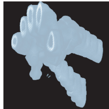
(b) (a, b, c) = (1, 1, 4) の場合