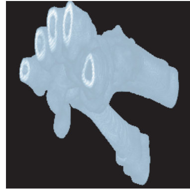
(a) (a, b, c) = (2, 2, 2) の場合

本稿では, 3 次元医用画像における方向別の画素相関の違いを考慮して, 方向別に異なる回数の DWT を適用することで, 3 次元画像データ圧縮が効率的に実現できることを確認した. スライス間隔が小さい場合は, z 軸方向の分割回数を大きく設定しても画質への影響は少ない. しかしながら, スライス間隔が広がるとスライス間の相関が低下するため, z 軸方向の分割回数をより小さく設定する必要がある. 画像の性質と画素間隔・スライス間隔を考慮して, 適切な方向別 DWT 回数を設定することで, 効率的な 3 次元医用画像圧縮を実現できる.