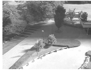
図4 基準画像の平均画像