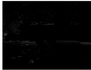
図6 基準画像の陰影変動候補画像