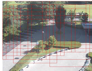
図8 高信頼動き推定の推定結果