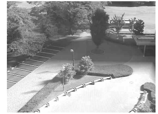
図5 対象画像の平均画像