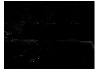
図7 対象画像の陰影変動候補画像