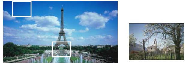
図 1 実験画像 (左側 : HDTV、右側 : SDTV。 左側の 2 つの枠内が部分画像)

WHT は \pm 1 の係数のみで表現できる行列式で表せるため、演算処理のコストは最も低い。SLT の最も低い AC 係数の変換基底は、1 次関数で表現できるものであるため雑音のないような信号の表現には有効と思われるが、浮動小数点演算を必要とする。DFT は今回検討した基底の中では演算処理コストが最も高いが、位相情報を表現できるという特長があげられる。