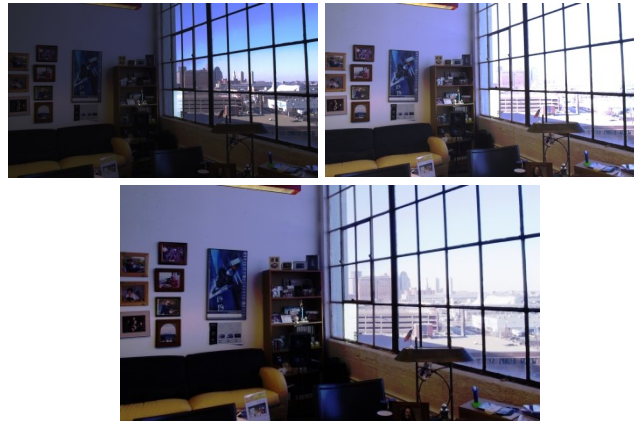
図3. 入力画像(上2枚)と処理結果画像(下1枚)。2枚の入力画像はそれぞれ室外と室内に露出を合わせたものを示した。

結果として得られた画像の例を以下の図3に示す。これはDurand [2]が公開しているRadiance MapをHDTV解像度の16bit float OpenEXR画像に変換を行って入力画像としたものである。このサンプルの室内外部分のように輝度の違う領域が均等に大きく分かれている場合は、グローバルオペレータでも十分良好な結果を得ることができた。トーンマッピング処理部のフレームレートは約180fpsであった。