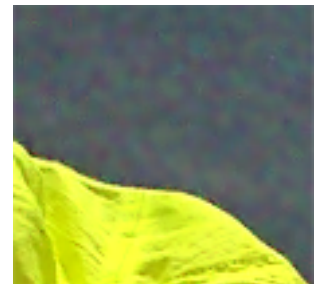
図5. 非階層型の冗長DCT (ブロックサイズ: 4 \times 4 )