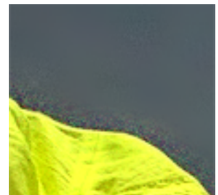
図7. 非階層型の冗長DCT (ブロックサイズ: 16 \times 16 )