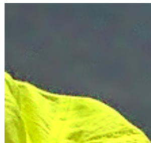
図6. 非階層型の冗長DCT (ブロックサイズ: 8 \times 8 )