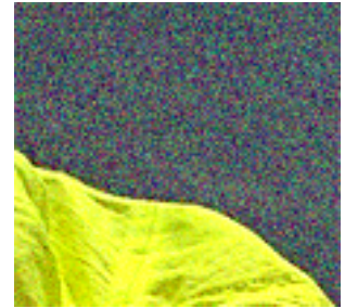
図3. 雑音付加カラー画像 (ISO1600相当)