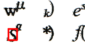
図 4: 接触文字に対する認識結果

参照画像に『4』を用いた時の結果で、切り出しおよび認識が正しく行われている場合と、図 3 のように参照画像と同じ文字を切り出しはしているが他の文字も多数切り出しをしている場合がある。miss は参照画像の文字を切り出す事が出来なかった場合を表す。参照画像 62 文字の認識結果を表 1 にまとめた。