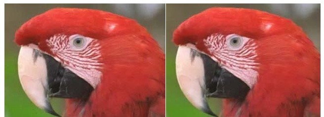
a) 交互反復Greedy解法の骨格 b) 射影勾配解法の骨格