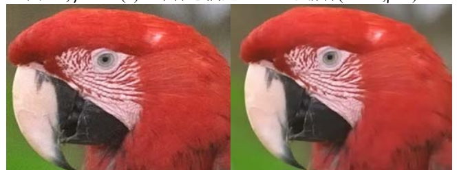
a) 交互反復Greedy解法の骨格 b) 射影勾配解法の骨格