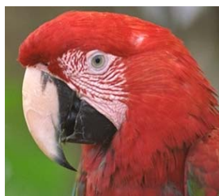
図1 入力カラー画像

図1のカラー原画像に標準偏差10の白色ガウス性雑音を付加した画像に、BV-G非線形カラー画像分解に適用した。この際、Soft Color-Shrinkageに、交互反復 Greedy 解法、及び射影勾配解法を採用した場合について、画像分解結果を比較した。本研究では、これらの両解法間で、種々のパラメータ設定において生じる違いを視覚的に