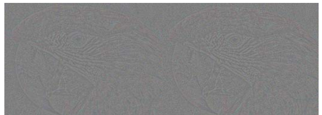
c) 交互反復Greedy解法のテクスチャ d) 射影勾配解法のテクスチャ 図2 \alpha, \beta が式(2)の条件を満足している場合 ( \alpha=0.3, \beta=0 )