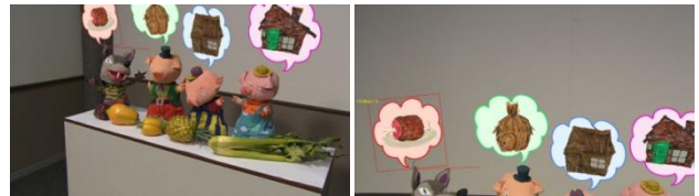
図3. カメラパラメータを適用したCG合成例 (上部の“吹き出し”がCG素材)

CG合成実験結果例を図3に示す。前述の演出によるテスト素材映像と、それに対する自動処理で生成したカメラパラメータを使用して生成させたCG素材を合成させた結果、精度よくCG合成が可能であることを確認した。