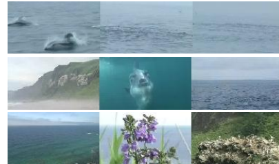
図2. キーワード「海」によるシーン検索結果例

素材映像のキーワードによる検索実験について、図2にその検索結果例を示す。キーワード検索については、テスト映像として使用した番組映像に含まれていた「山」や「海」をキーワードとした場合については良好な検索結果となった。またクエリ画像検索においても、視覚的に類似する候補をピックアップすることができた。