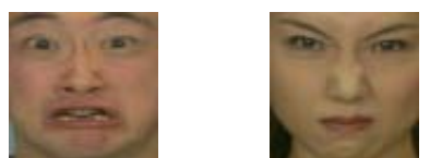
(a) 恐れ (b) 怒り (閉口)