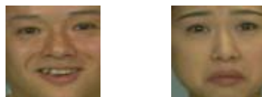
(a) 怒り (開口) (b) 喜び (開口) (正解: 喜び (開口)) (正解: 悲しみ)