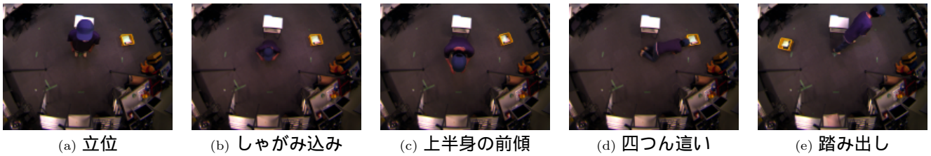
図 2: 上方から見た教示姿勢