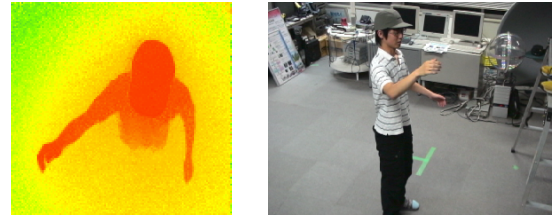
(a) 俯瞰距離画像 (b) 横から見た様子

本研究では、撮影環境の制限により人物の上方に距離画像センサを設置する。上方から撮影した距離画像(以下、俯瞰距離画像)の例を図1(a)に示す。距離画像センサより得られる距離情報から2.1節に示す姿勢を反映した特徴量を抽出し、評価関数を用いて教示姿勢に対する入力された俯瞰距離画像中の人物姿勢の評価値を算出する。人物の姿勢は評価値が最小となる教示姿勢として推定する。本研究で対象とする姿勢は、図2に示す「立位」