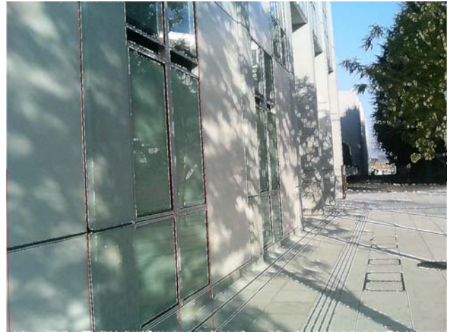
図4 直線ハフ検出結果(エッジ方向誤差 0^\circ )

ハフ投票と粗走査ピーク検出に対応する抽出直線結果を図4、図5に示す。両図は原画像に尾根点を白点で重ね表示し、さらにその上に抽出された直線を赤で重ね表示している。図4では、エッジ方向の誤差を考慮していないため、抽出されるべき直線の乗る尾根点が原点からの垂線の足の近くにある線のみ抽出されていることが分かる。こ