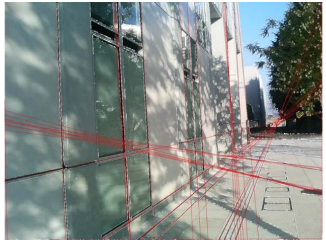
図5 直線ハフ検出結果(エッジ方向誤差 \pm 3^\circ )

れに対して、エッジ方向の誤差を \pm 3^\circ 考慮した結果である図5では、所属する尾根点が十分な数抽出されている直線はほぼすべて抽出され、その抽出された直線の精度も良好であり、雑音線や類似近接線も殆ど出ていないことが分かる。