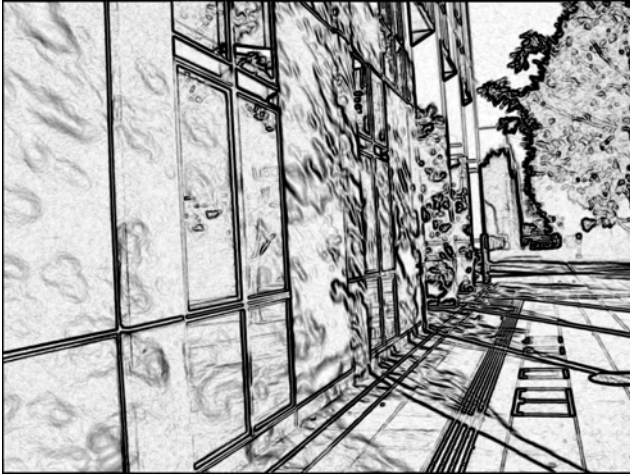
図2 エッジ検出結果

これに対してエッジ検出した結果のエッジ強度画像を図2に示す。図ではエッジ強度0を白とし、エッジの強さを黒の濃さで表現している。