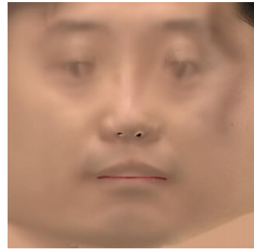
図3 テクスチャマッピングの例 (80 フレームから)

図3は 80 フレーム (正面→左横顔) の映像からマッピングしたテクスチャを示す。ここで重みの \alpha は \cos^2(\bullet) とした。鼻孔にアーティファクトが見えるが、そこは鼻の中の見えない場所に相当するなのでマッピングされない。