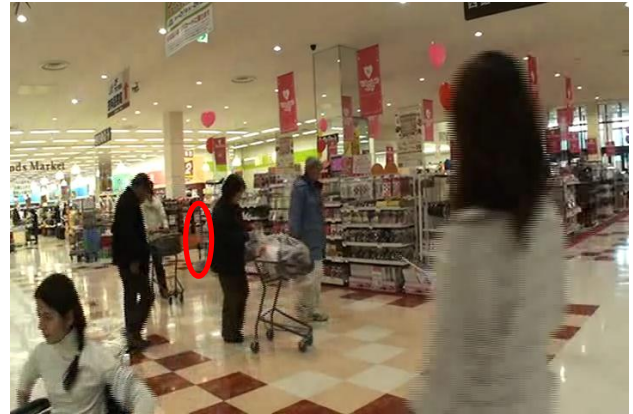
図3. 実験環境(円内にLRF)

今回の実験では軌跡データ35240対についてグループ推定を行った。提案手法の実験結果として、各時刻における