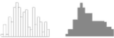
図 1: 入力関数 f(x) (左図) と出力関数 \phi(x) (右図)

データベースには離散値を持つカテゴリ属性データと連続値をもつ数値属性データがある。数値属性データを扱う場合は、数値データの2値化が必要である。ところが、数値属性の2値化で予測精度が悪くなる欠点がある。決定木による知識表現の場合は、2値データに対しては良い予測精度をもつが、数値データに対してはうまくいかない。数値データの2値化には誤差が生じ、情報のロスがある。数値データに対して、分類精度を向上させるためには木を大きくすれば良いが、予測精度は低下してしまう。