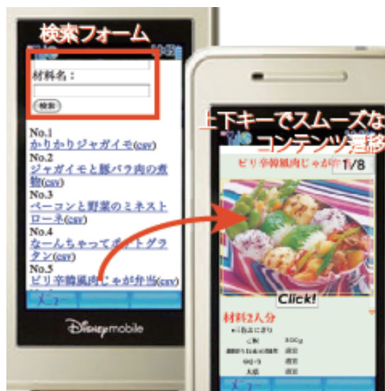
図 1: 本レシピ検索システムの実行例