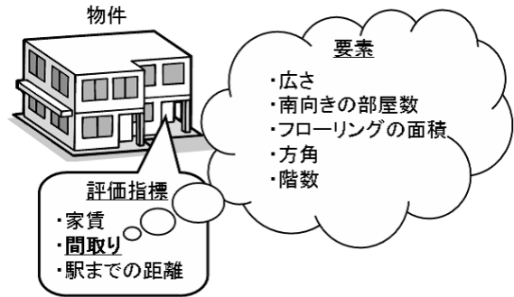
図 1: 物件の評価指標と要素

本研究の目的は、顧客の嗜好を最もよく表現する要素の重みのバランスを同定することである。顧客の嗜好が影響する評価指標として間取りを取り上げる。